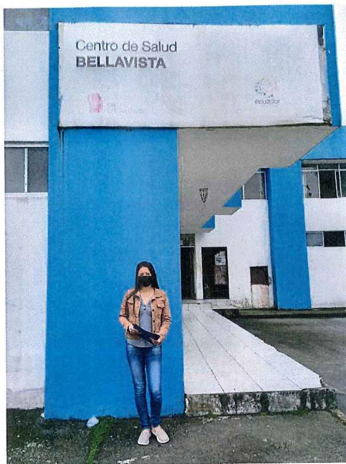
Fuente: Centro de Rehabilitación Social – Centro de Salud Bellavista