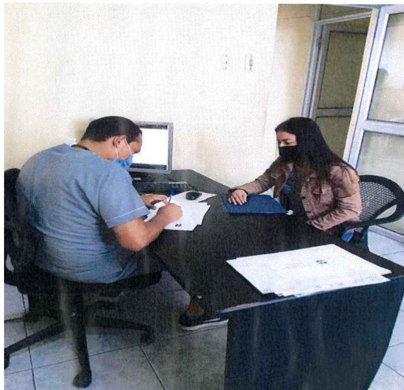
Fuente: Encuesta al doctor Centro de Salud Bellavista