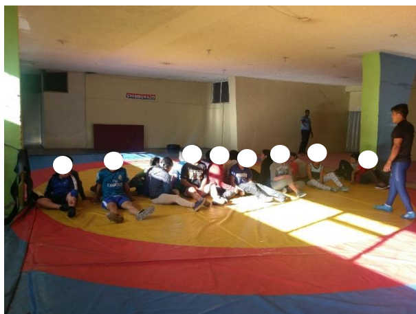
Entrenamiento del equipo de Lucha categoría menores Coliseo Teodoro Gallegos Borja