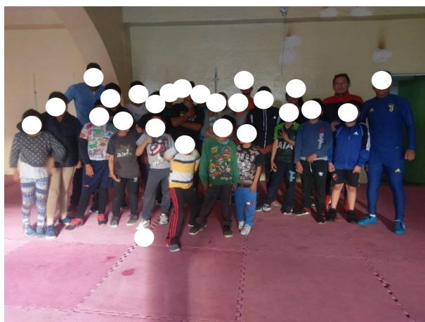
Equipo Categoría Menores de la Federación Deportiva de Chimborazo