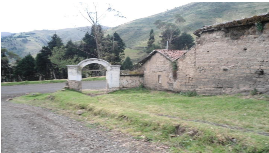
Imagen: Entrada a la comunidad de Shulala y la vía antigua a Riobamba Gallarumi