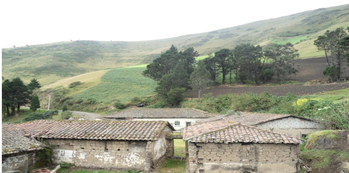
Imagen: Antigua hacienda de las Herrerías - Shulala