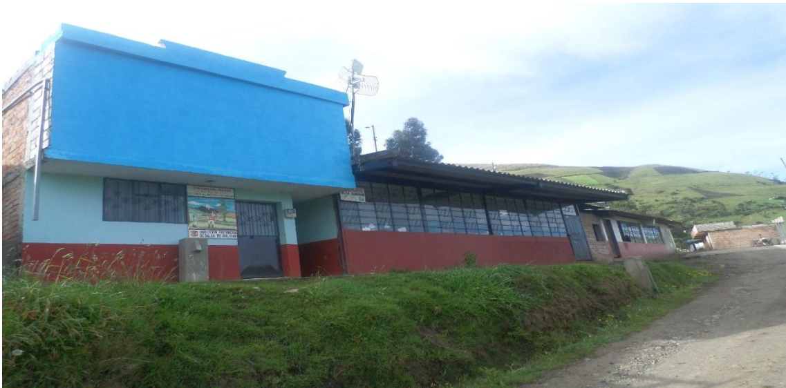
Imagen: Escuela Celso Virgilio Espinosa de Shulala.