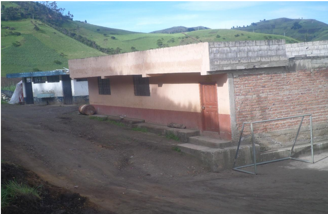
Imagen: Casa comunal actual de Shulala.