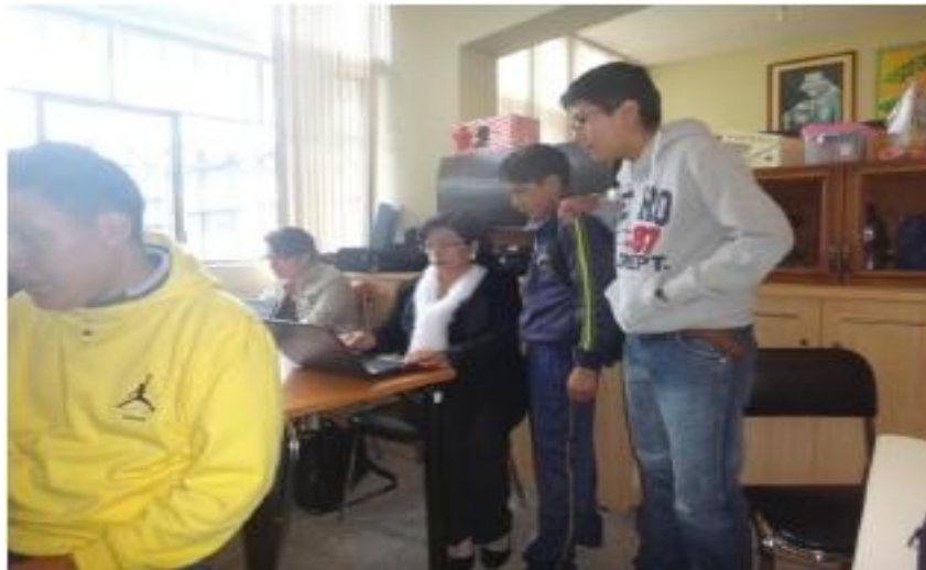
Fuente: docentes realizando trabajo personalizado con estudiantes Realizado por: Mercy Reinoso