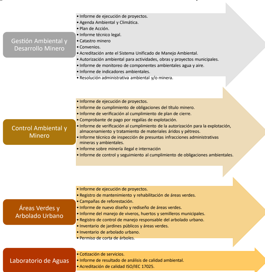
Figura 1 Servicios de la Dirección de Gestión Ambiental del GAD Municipalidad de Ambato

Nota. Elaboración propia. Adaptado de (GAD Municipalidad de Ambato, 2022).