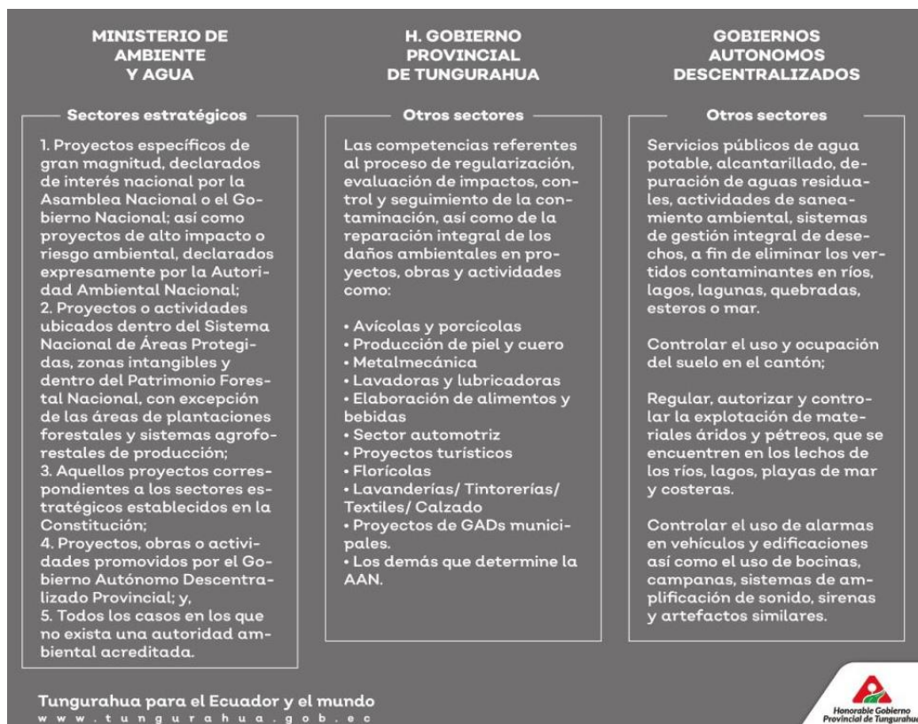
Figura 2 Competencias descentralizadas en la gestión ambiental