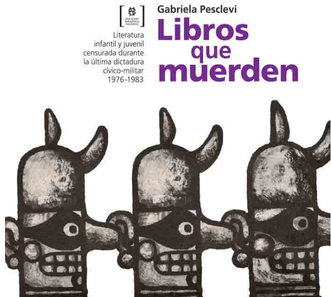
Figura 3: Programa Libros que muerden

A través de una colección de literatura heterogénea y diversa, la comprensión de la memoria de la violencia política puede ser abordada, el reconocimiento de la función social de las LEO en una experiencia como esta está completamente viva y a disposición no solo de la sociedad argentina sino del mundo entero, pues el lenguaje como artilugio compartido permite acercarnos al horror de la guerra, de la violencia, para concientizarnos de que otras formas de organización social son posibles.