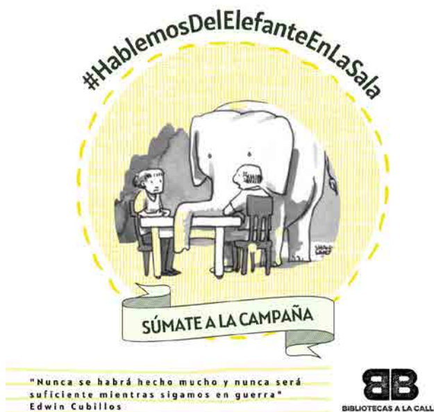
Figura 4: Programa del Elefante en Sala

Esta campaña ha congregado la palabra en múltiples formas y formatos y ha presentado alternativas para hablar de lo innombrable mediante el arte y la literatura. La intención de la campaña del Colectivo Bibliotecas es aportar al cuidado y defensa de bienes colectivos como la cultura y la educación a través del conocimiento de hechos sociales que parecen pasar desapercibidos pero que realmente se presentan socialmente y evadimos de manera constante.