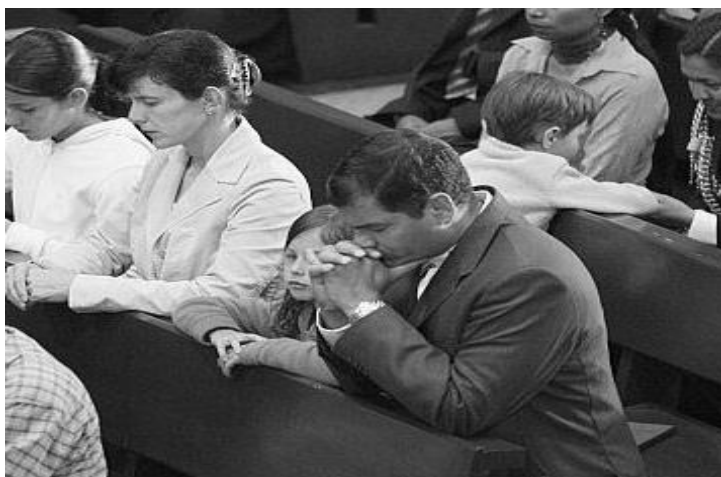
El presidente acude a la iglesia junto a su familia, previo a las votaciones por la Asamblea Constituyente del 2007.