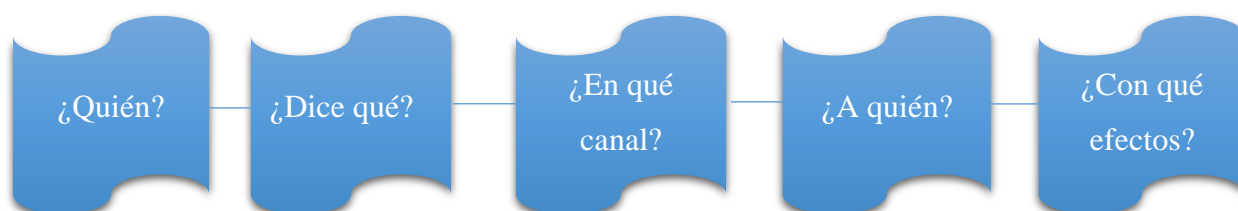
Gráfico 1. Paradigma de Laswell