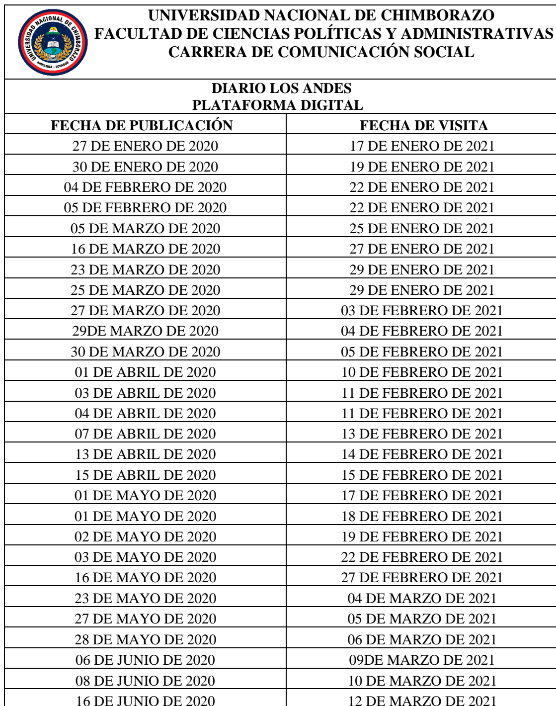
Tabla 4. Guía de visita a la web