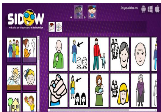
Figura 3: Captura de Pantalla del Tablero de Comunicación para la Web