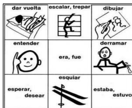
Figura 1: Pictogramas del Tablero de Comunicación

manual; y tercero, las imágenes son carga de memoria de recuperación reductora estacionaria (Miranda, 2003).