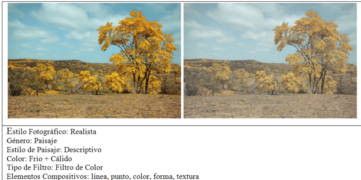
Tabla 3: Árbol de Guayacán