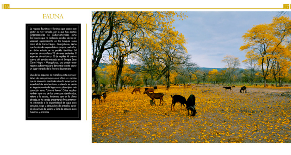
Figura 6: Página interior del fotolibro