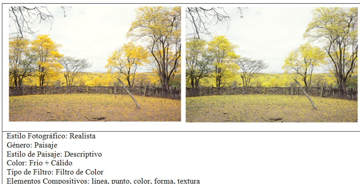
Tabla 1: Establo para caprinos