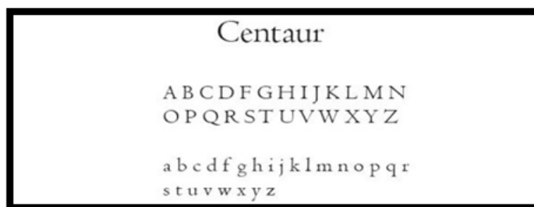
Figura 2: Tipografía Centaur aplicada en títulos y subtítulos