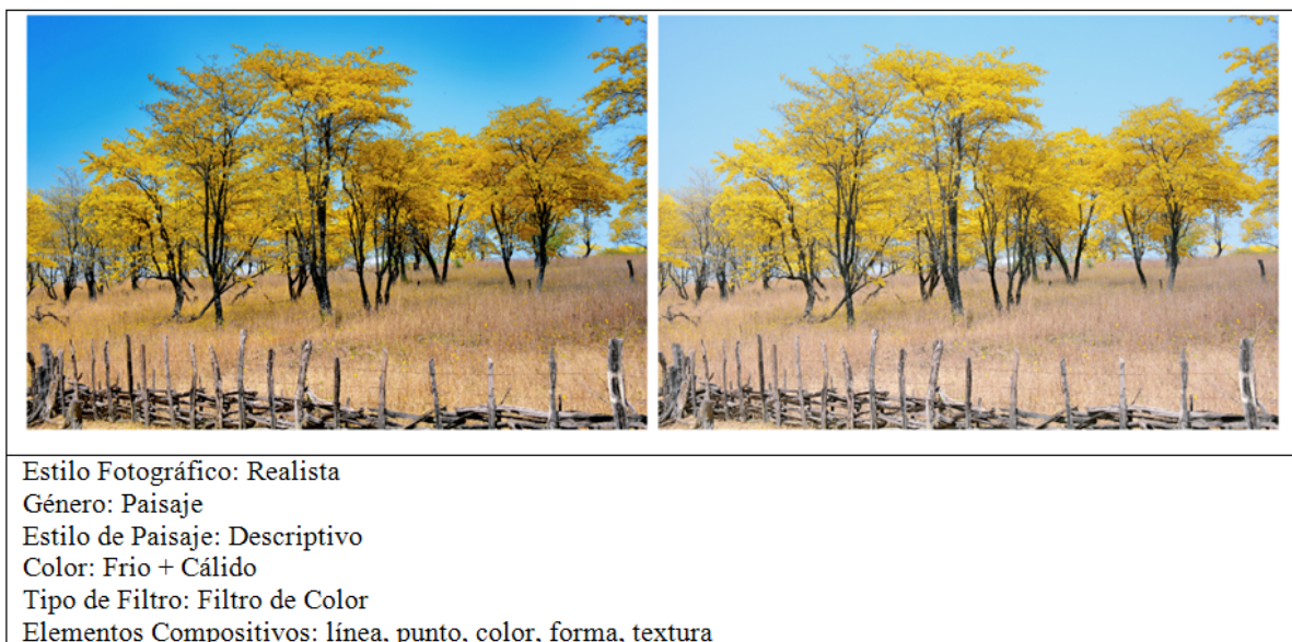
Tabla 2: Guayacán y sus senderos