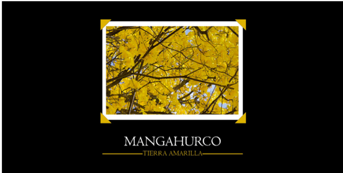
Figura 5: Portada del fotolibro

extensión del documento se ha seleccionado una muestra representativa.