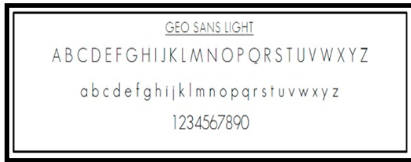
Fuente: Tipografía empleada para la maquetación del fotolibro