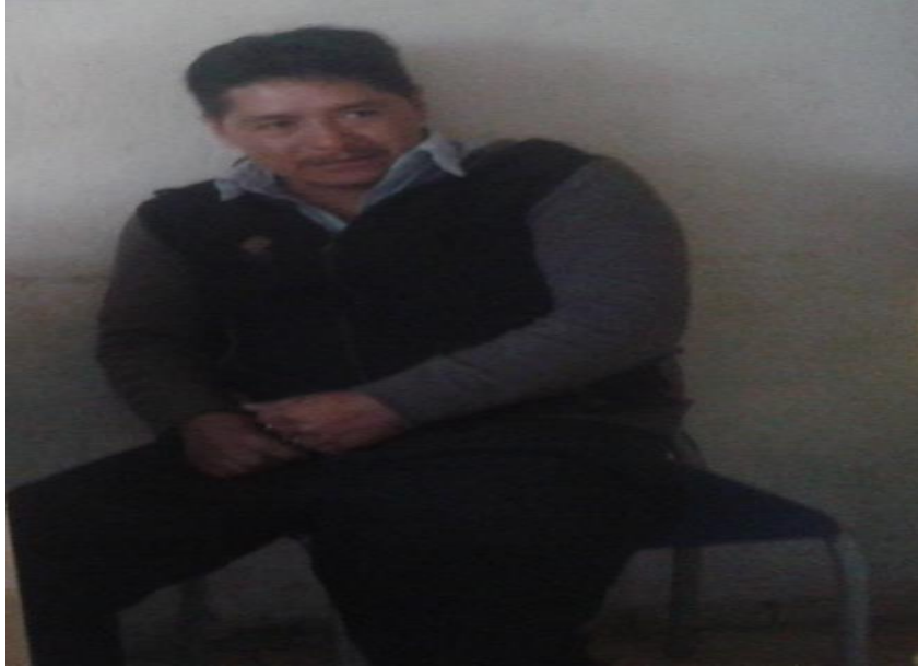
Fuente: Morador de la parroquia