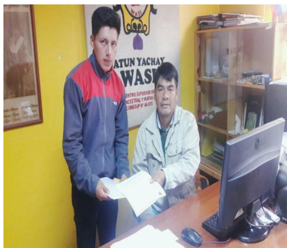
Autor: Wilmer Guamán