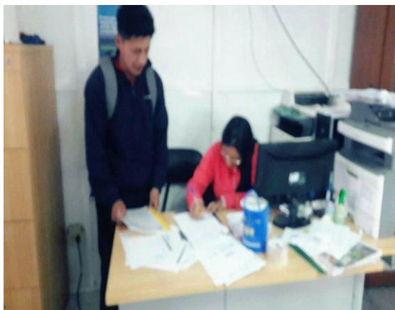
Autor: Wilmer Guamán