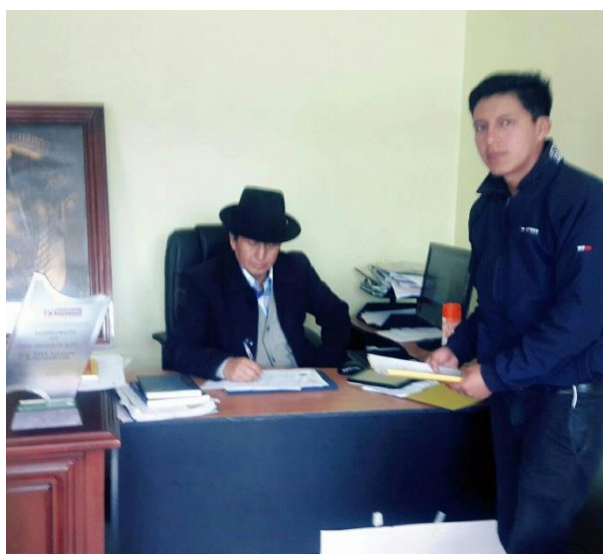
Autor: Wilmer Guamán