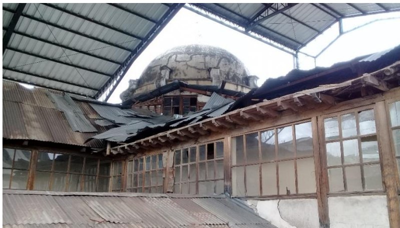
Ilustración 10: Vista Posterior de la cúpula del Teatro León en la actualidad.