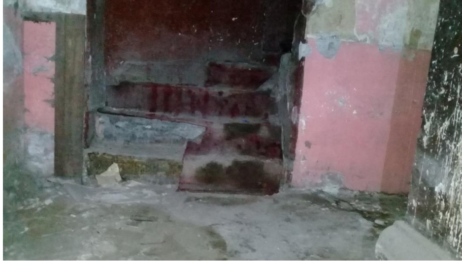
Ilustración 6: Gradas cubiertas por una alfombra roja, se encuentra en total deterioro.

Al ver la parte interior del teatro nos damos cuenta que en su época dorada brillaba con tan esplendor que se llegó a ser reconocido por muchos y pocos en el ámbito nacional, tanto por su infraestructura neoclásicas así como por las obras que eran presentadas en el teatro.