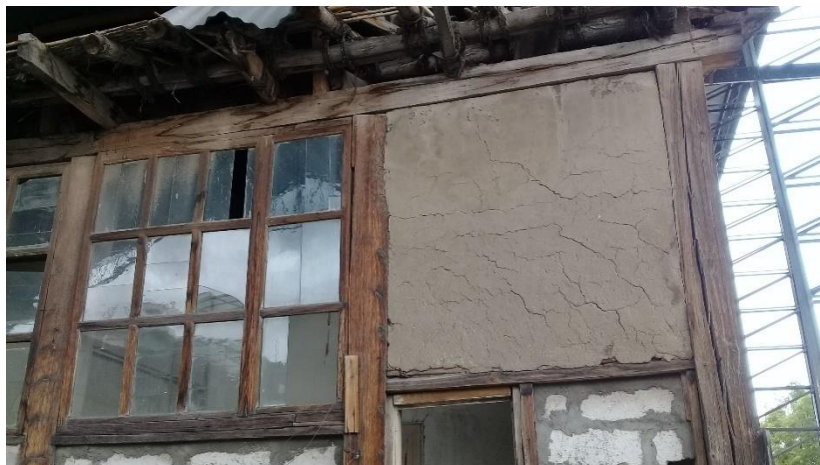
Ilustración 11: Adobe y cujes como elementos constructivos: del Teatro León