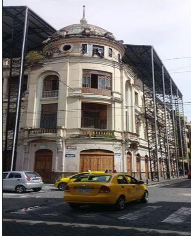
Ilustración8: Fachada del teatro León