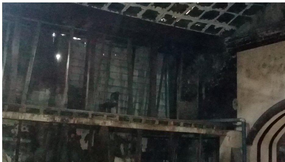
Ilustración 5: Segunda planta del teatro León.

El teatro León se define por su gran y esplendorosa arquitectura, por su amplia sala de reproducción cinematográfica y más que todo por su amplia sala de escenografía, por la misma que han pasado grandes artistas de renombre nacional, personajes de política que han dado discursos, fiestas conmemorativas de la ciudad de Riobamba al igual que películas de estreno.