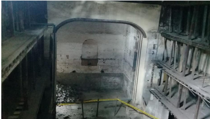
Ilustración 7: Interior del Teatro León, con nivel de deterioro del 60%