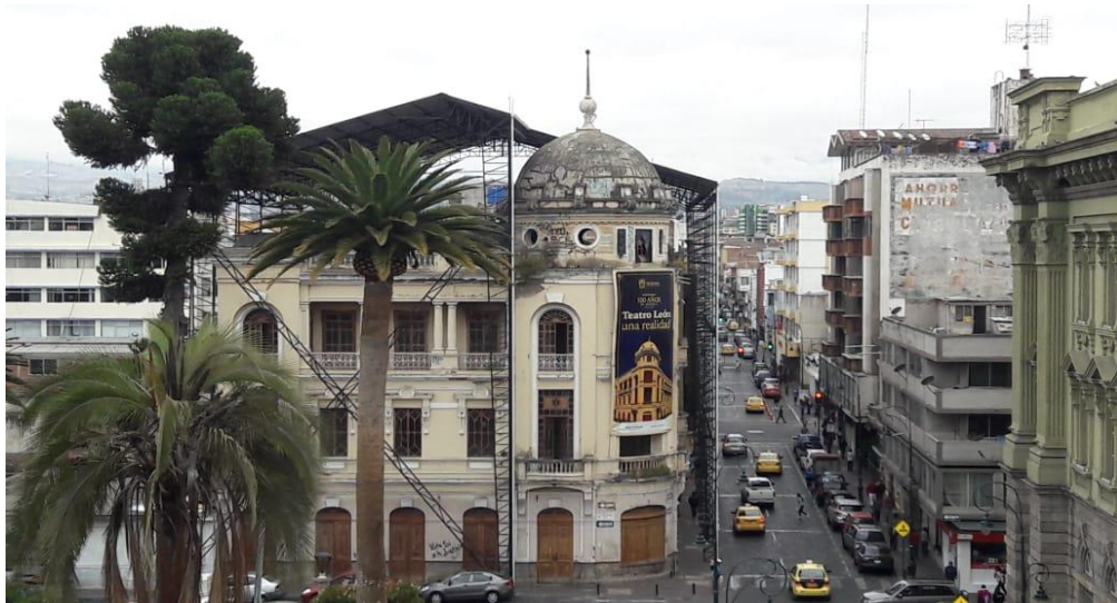
Ilustración9: Fachada del Teatro León