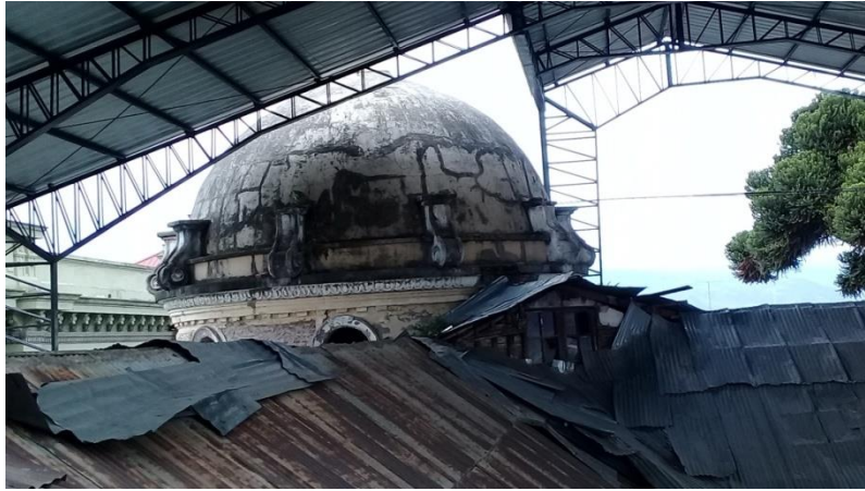
Ilustración 7: Parte posterior del Teatro León.

En última planta alta se encuentra lo que es la cúpula misma que tiene varios ventanales circulares, por lo mismo que se pueden observar el hermoso parque Sucre y también era utilizada como una sala de reuniones por su gran amplitud que posee, los bellos adornos de tabla que tiene en el piso, a continuación de la cúpula se encuentra la sala de proyección en la misma que se encontraban las máquinas de proyección y los principales responsables de proyectarlas y si se quemaban las cintas poder pegarlas para que continúen con la proyección.