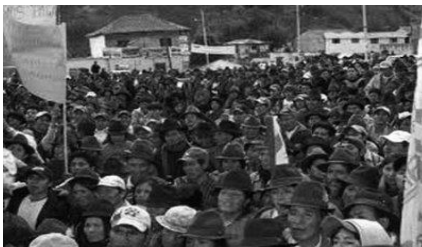
Figura 1. Levantamiento del pueblo por las principales calles de Riobamba.