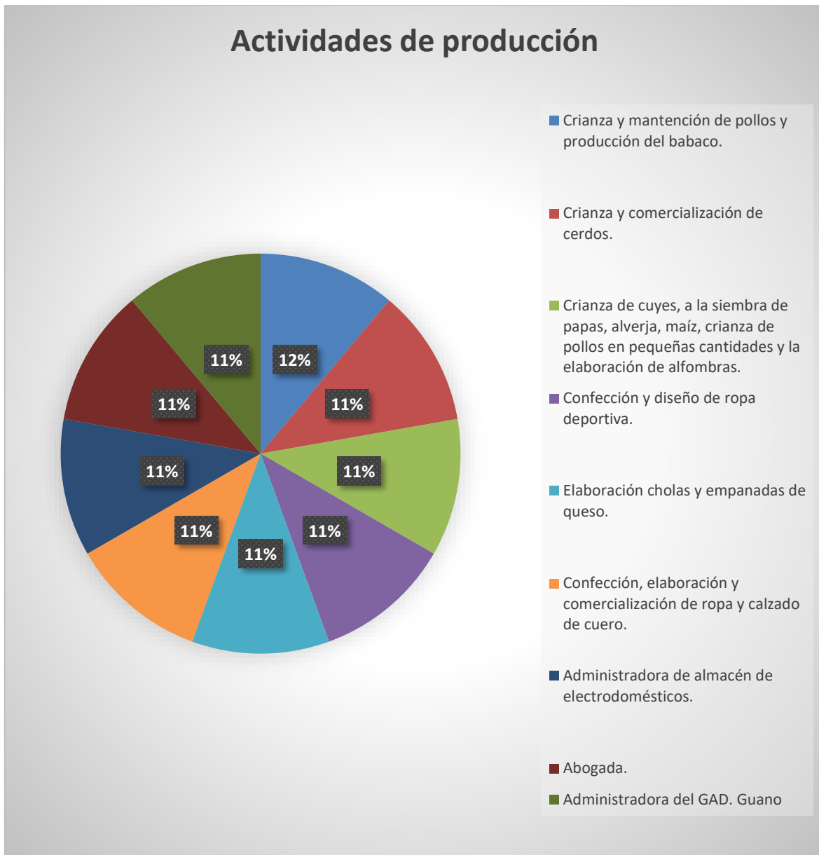
Figura. 2 Porcentaje de la participación de las mujeres en los sectores de producción.

Elaborado por: Gladys Paulina Yumiceba Yumiseba