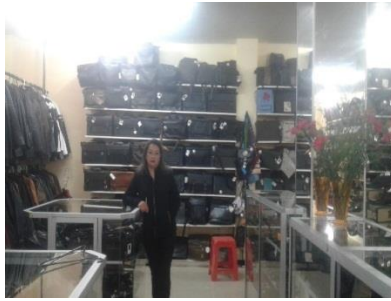
Elaborado por: Gladys Paulina Yumiceba Yumiseba.