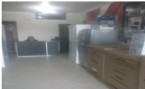
Elaborado por: Gladys Paulina Yumiceba Yumiseba.