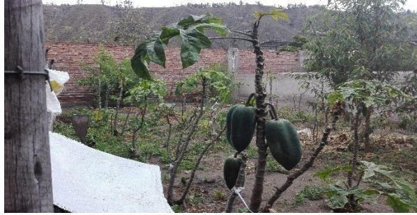
Elaborado por: Gladys Paulina Yumiceba Yumiseba.