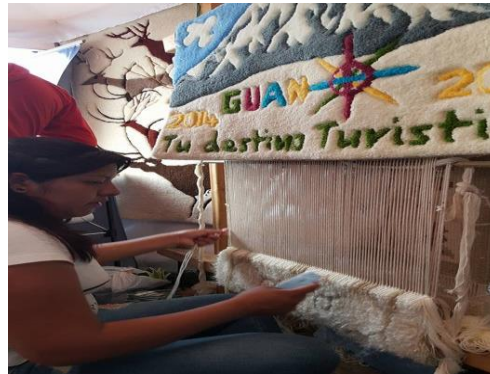
Elaborado por: Gladys Paulina Yumiceba Yumiseba