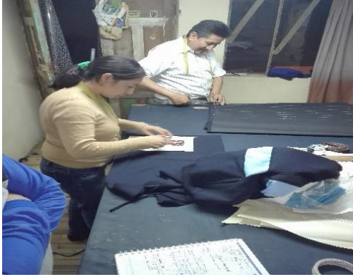
Elaborado por: Gladys Paulina Yumiceba Yumiseba.