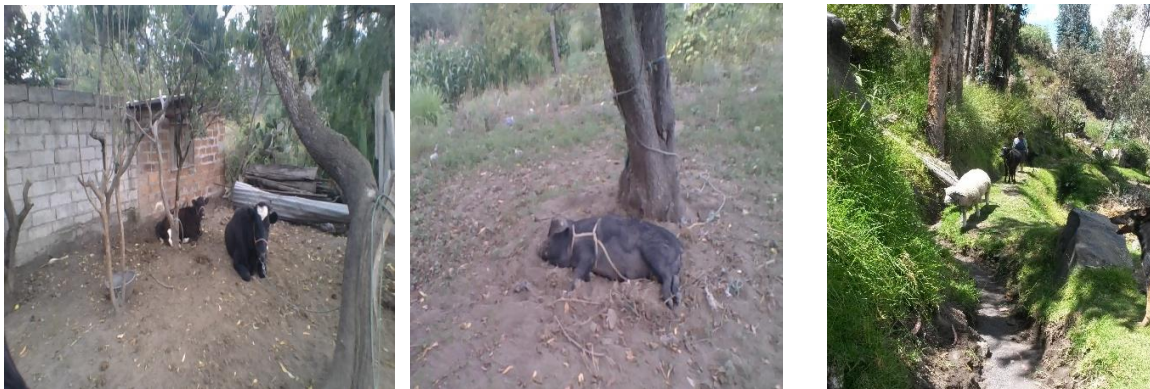
Elaborado por: Gladys Paulina Yumiceba Yumiseba.