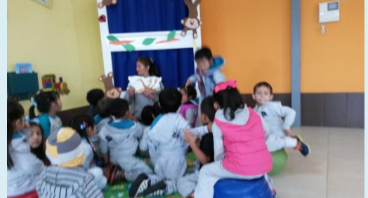
Fuente: Estudiantes de Inicial II del Centro de Educación Inicial Pekelandia Riobamba período 2016