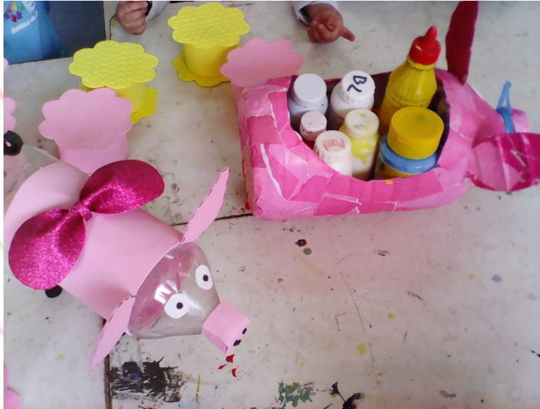
Fuente: CIBV "Gotitas de Dulzura" Elaborado por : Tito Huilca Logroño