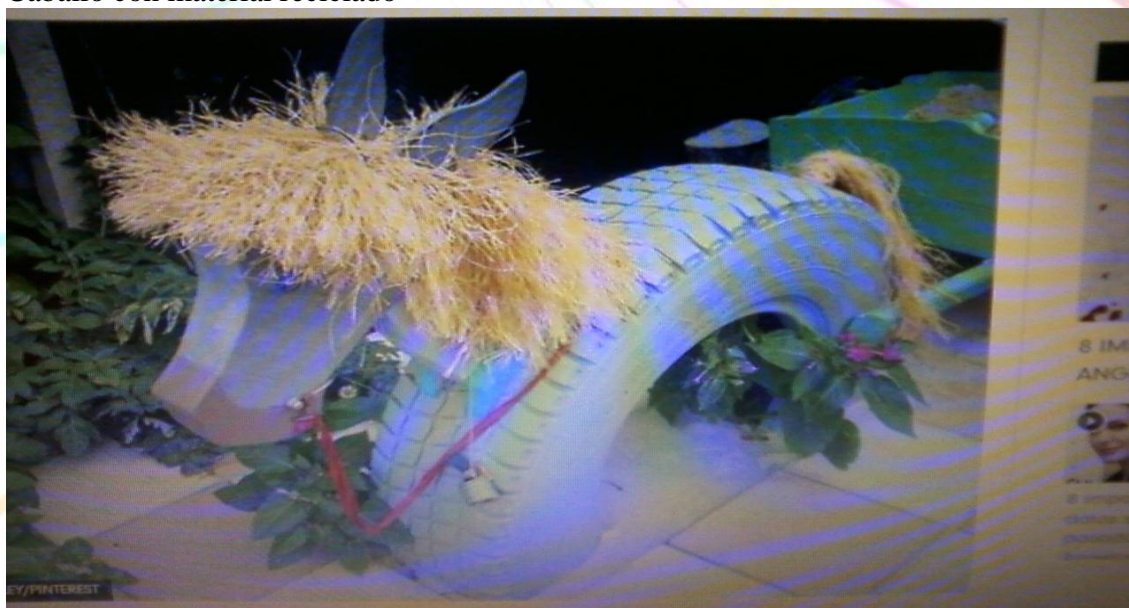
Caballo con material reciclado

Ejecutar actividades de con recursos del medio con los niños y niñas del CIBV "Gotitas de Dulzura" para el desarrollo de la motricidad fina, apoyando en el proceso educativo.