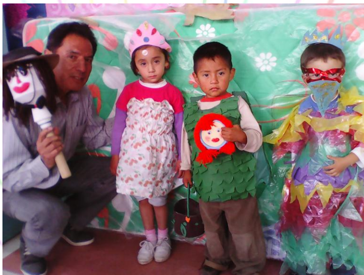
Fuente: CIBV "Gotitas de Dulzura" Elaborado por: Tito Huilca Logroño

Objetivo: Identificar las características generales que diferencian a niños y niñas, reconociéndose como parte de un género para fortalecer su identidad.