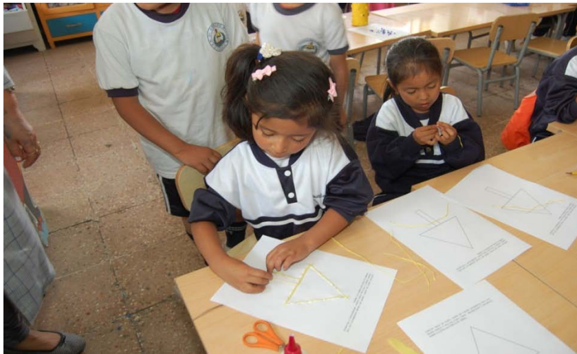
Fuente: Niñas de la Escuela Dr. Arnaldo Merino pegando tiras alrededor del gráfico