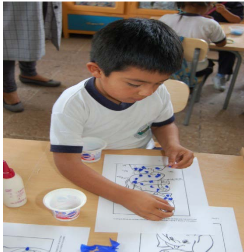
Fuente: niños de la Escuela Dr. Arnaldo Merino pega papel