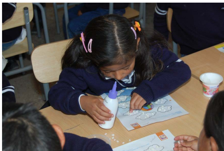
Fuente: Niñas de la Escuela Dr. Arnaldo Merino en la hoja de trabajo