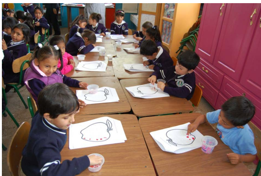
Fuente: Niños y niñas de la escuela Dr. Arnaldo Merino, terminando con el proceso de tazado