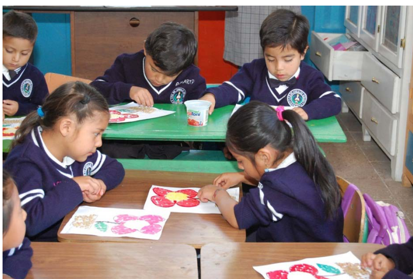
Fuente: Niños y niñas de la escuela Dr. Arnaldo Merino, terminando con el proceso de tazado