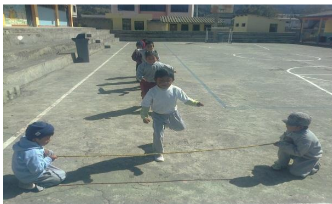
Los niños saltan la sogá