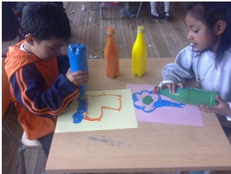
Los niños pintan con botellas

Yo tengo un carrito Viejo quién me lo quiere comprar lo vendo porque esta viejo y ya no camina más las llantas de pan con queso las ventanas de cartón las puertas son de madera y el chofer se chicharon