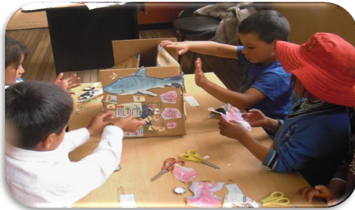
Los niños realizan un collage

Cajita de sorpresas que cositas guardaras ahora te abriré seguro me divertiré