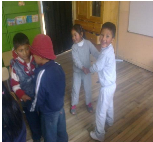
Los niños bailan en parejas

Para bailar me pongo la capa Pues sin capa no puedo bailar Me quito la capa, ya que con capa No puedo bailar ¿Qué será? El trompo