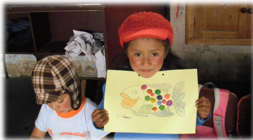
La niña decora la figura con plastilina