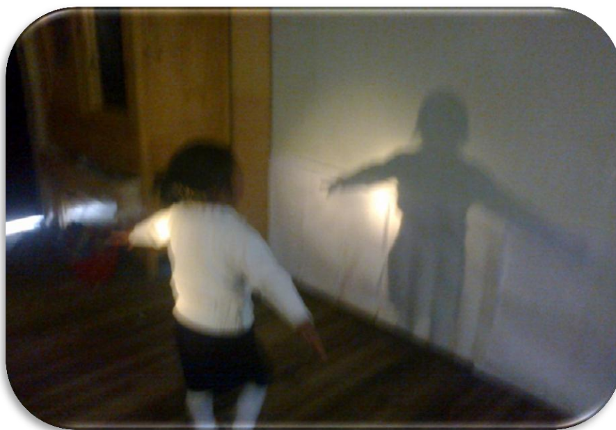
La niña baila