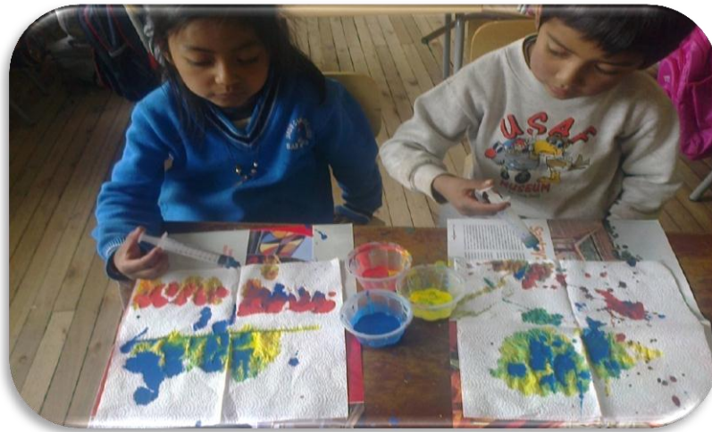
Niños mezclando colores primarios

Del cielo bajo un pintor a pintar tu hermosura y al verte despeinada se de cuajo la pintura