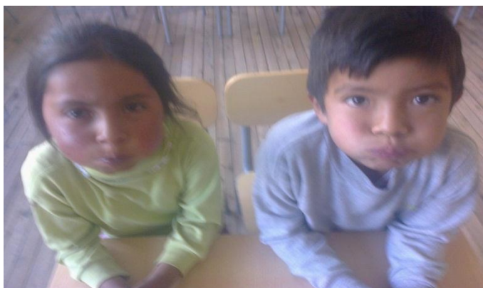
Niños llenando de aire la boca

Una señora muy aseñorada nunca sale de casa y siempre esta mojada ¿Qué será? La lengua