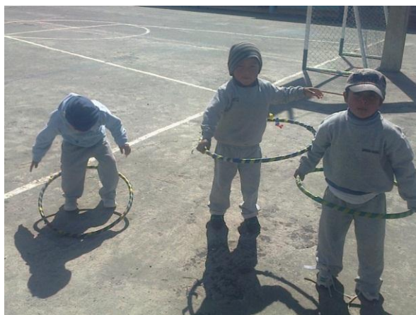
Los niños giran la ula en la cintura

OBJETIVOS DE APRENDIZAJE. - Desarrollar la habilidad de coordinación motriz gruesa mediante el movimiento .