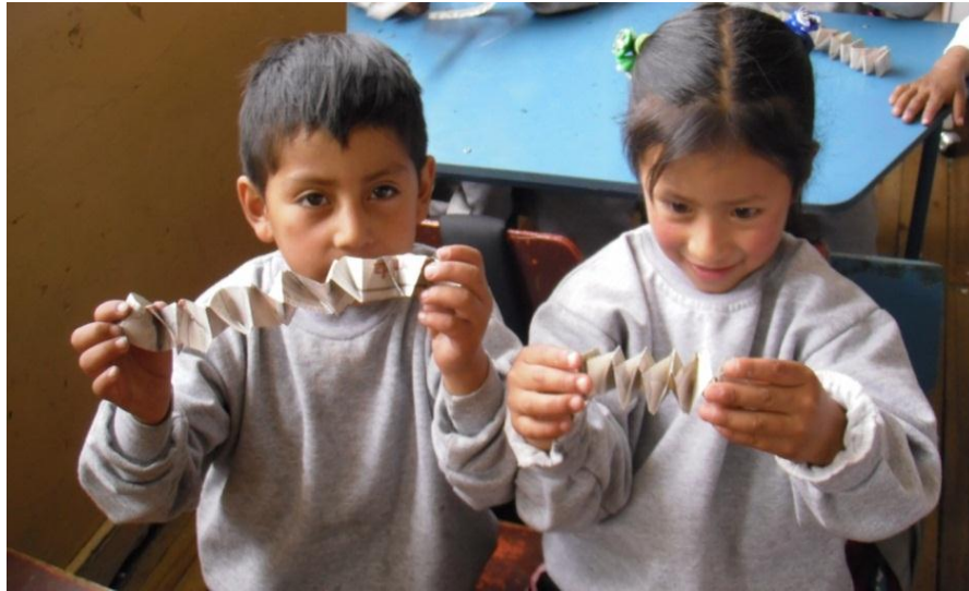
Los niños manipulan papel