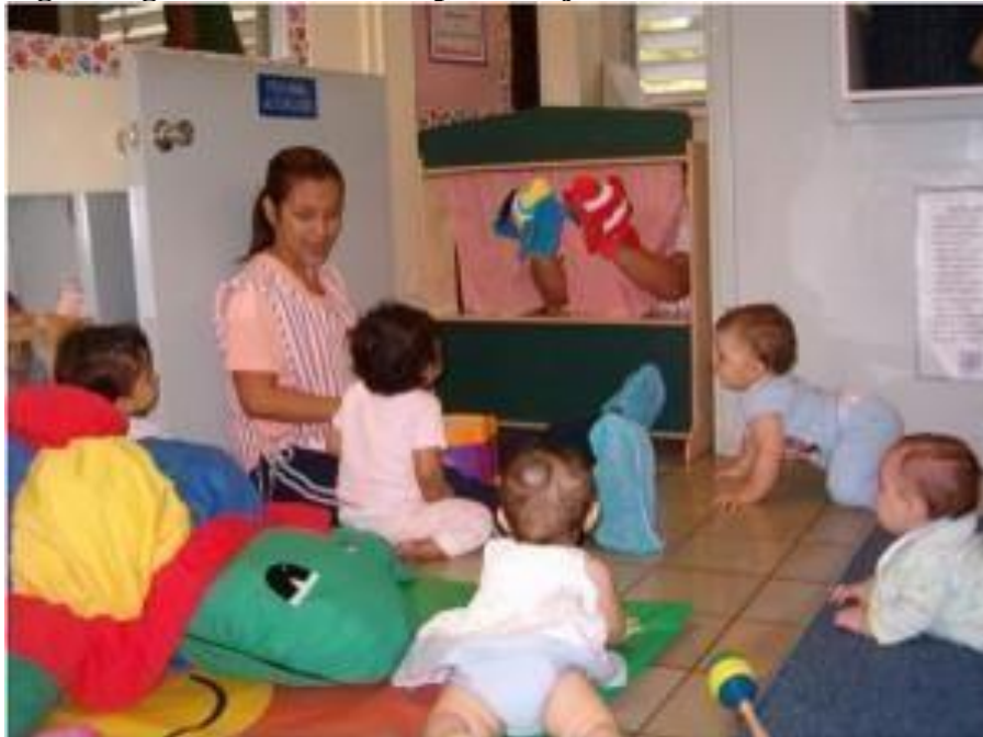
Fig1. Juego como medio de aprendizaje