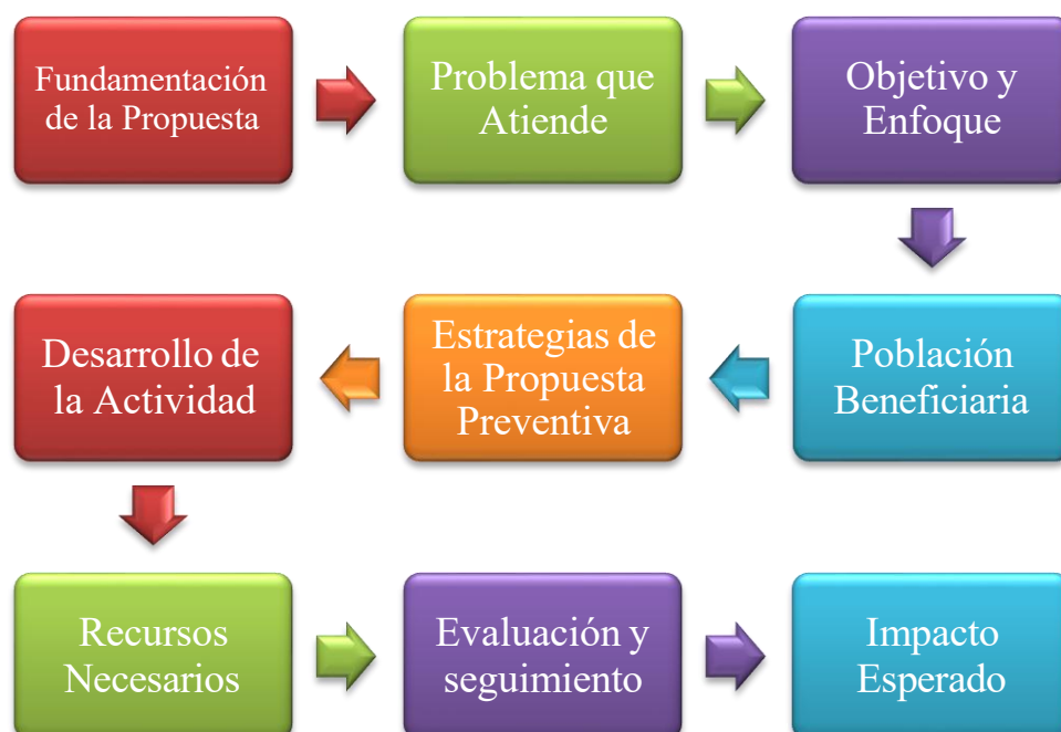
Figura 3. Estructura de Propuesta Preventiva

Nota. Estructura de la propuesta preventiva mediante estrategias y evaluación.