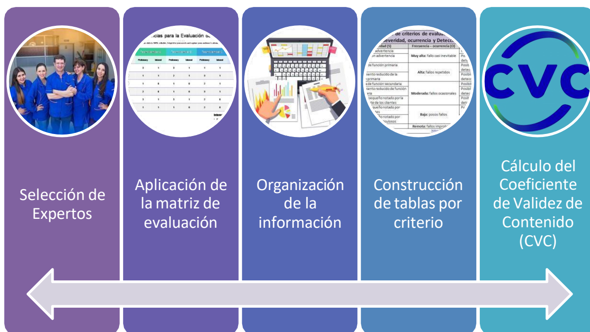
Figura 2. Procedimiento para la validación del Instrumento

Nota. La figura presenta el procedimiento para la validación del instrumento.