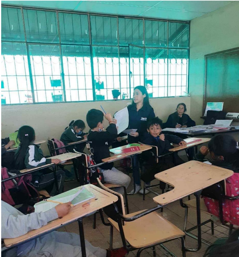
Ilustración 1 Evidencia de la encuesta aplicada a Sexto año de educación básica.