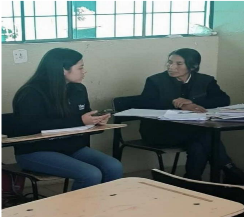
Ilustración 2 Evidencia de la entrevista a la docente tutora