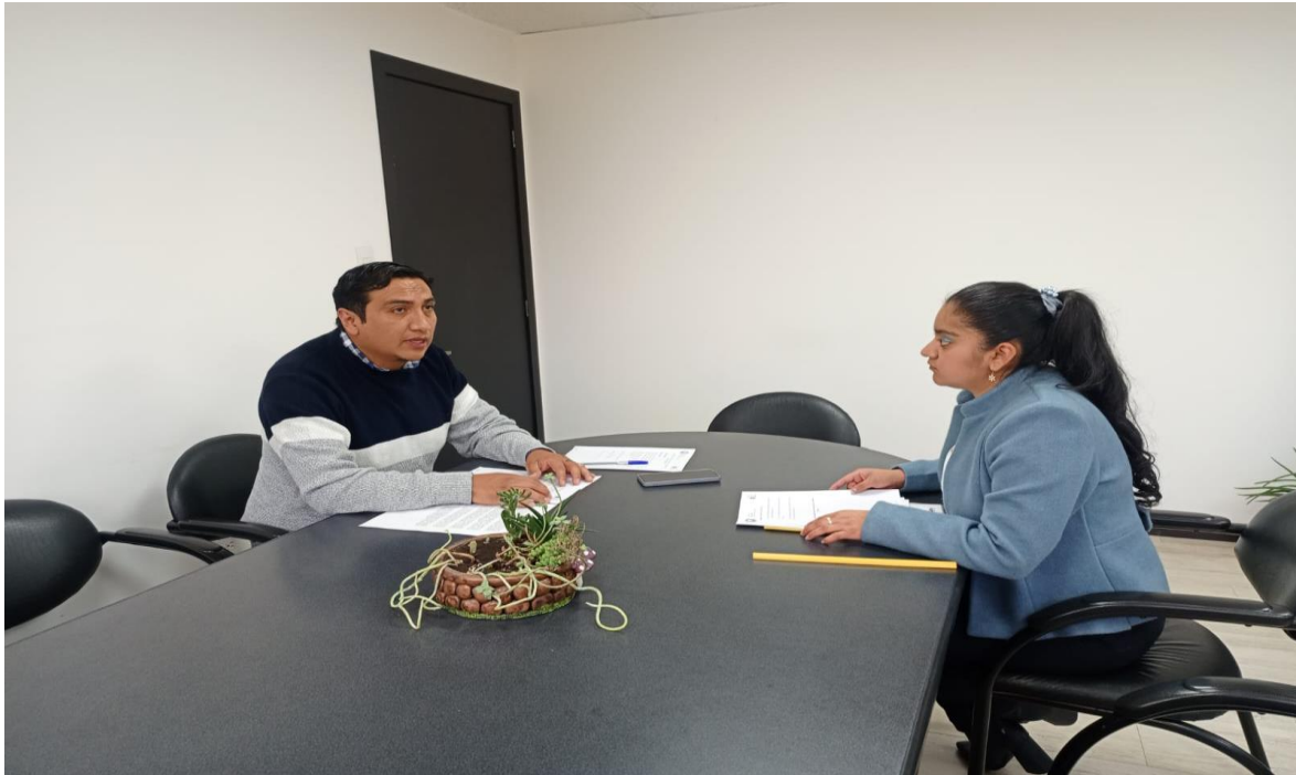
Nota: Entrevista realizada a fiscales y jueces de la ciudad de Riobamba. Realizado por: Katherine Michelle Martínez Coronel.