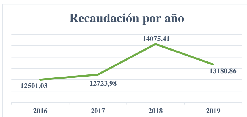
Gráfico 1: Recaudación por años

Nota: (Servicio de Rentas Internas, 2024)