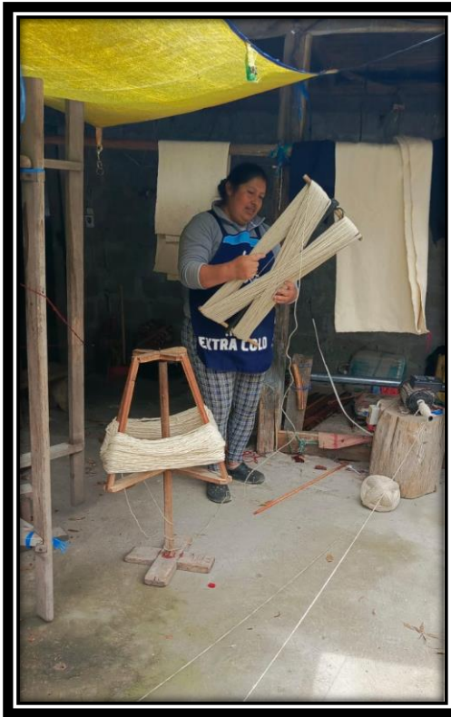
Destrozadora, máquina para torcer los hilos.