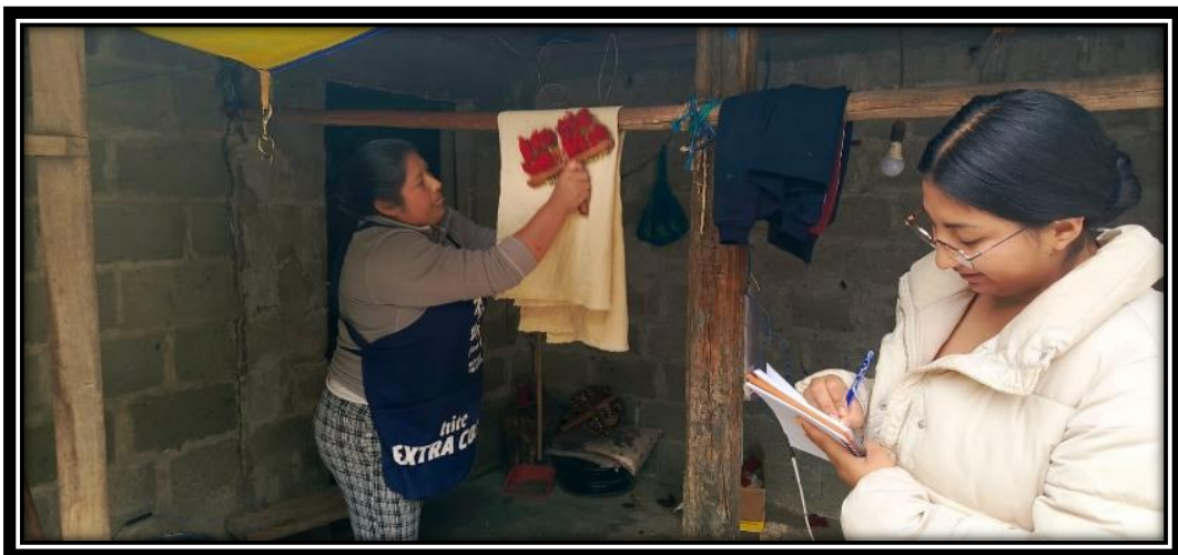
Cerdón, para sacar sobrantes de lana y hacer más sedosa el tejido.