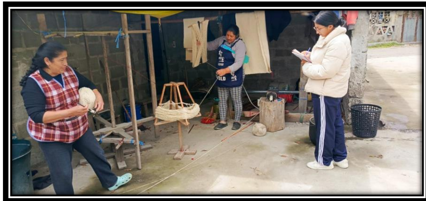
Muchacho, máquina para deshilar