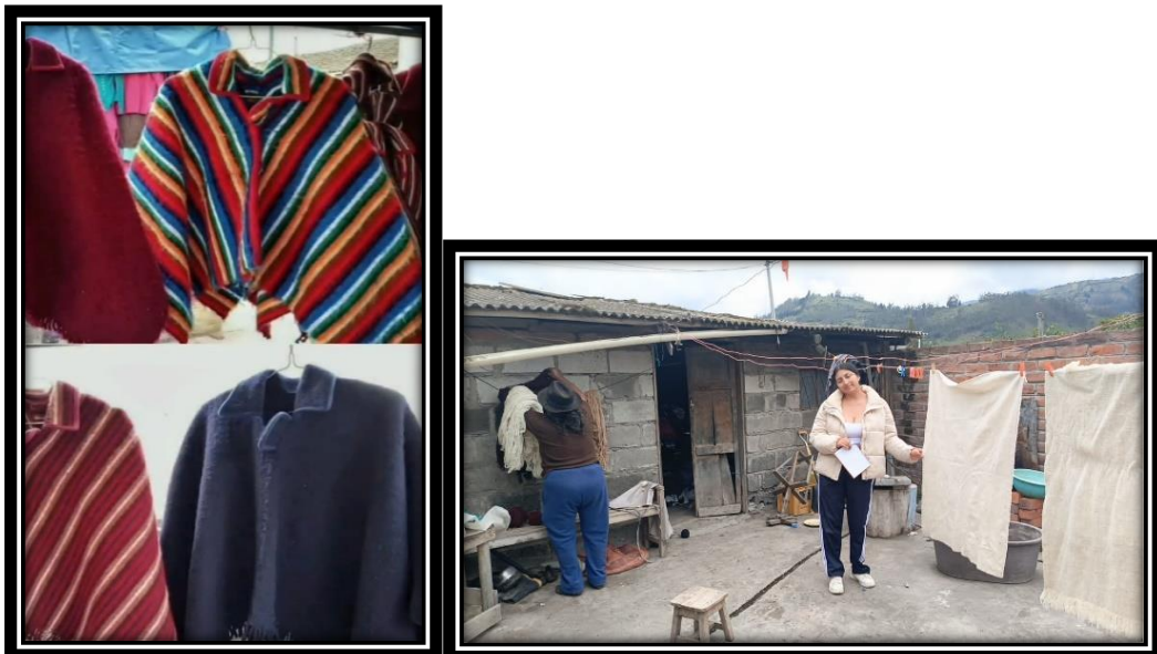
Ponchos y chalinas terminados.