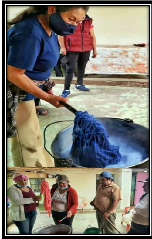
Tintes naturales para los hilos.