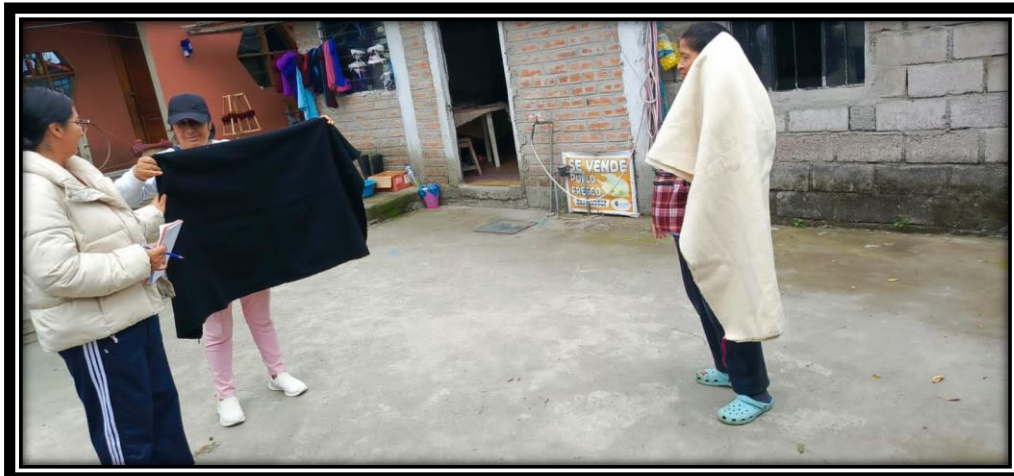
Chalinas antes de ser quitadas la lana sobrante tomando su medición precisa.