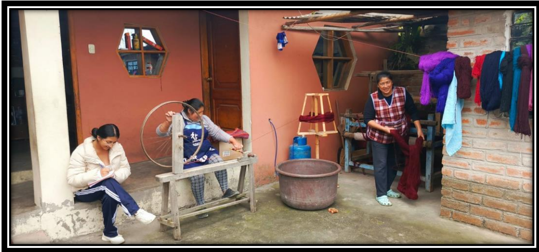
Rueda giratoria, para hilar fibras naturales.