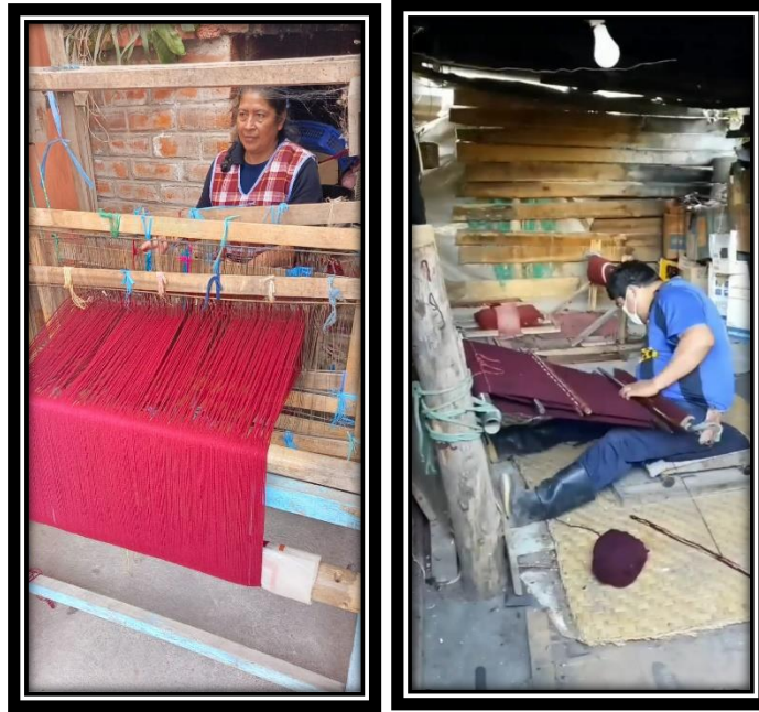
Telar, se debe pasar hilo por hilo.