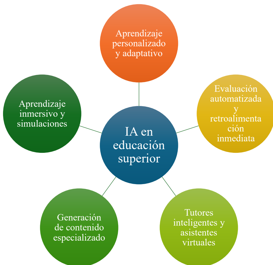
Figura 1. Tendencias de la IA en educación superior

Nota: Elaboración propia de los autores.