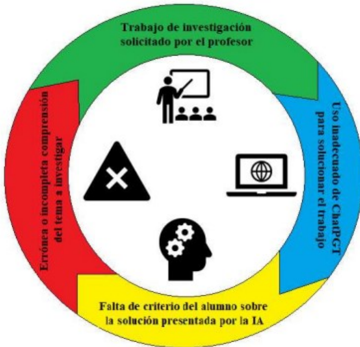
Figura 2. Círculo vicioso del mal uso de ChatGPT.

Nota: Extraído de Avalos et al., (2024).