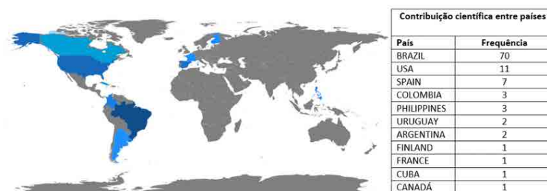
Figura 1: Os diferentes cenários dentro das publicações

Dentre as palavras mais usadas dentro dos artigos se destacam educação, mulher, homem, humano, artigo, Brasil, adulto, experiência humana, entrevista. Como programa Bibliometrix foi possível criar a nuvem de