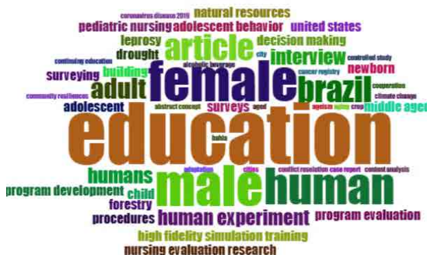
Figura 2: Nuvem de palavras

Dentre os 8 artigos publicados no banco de dados Periódicos Capes, encontra-se um de Ossola (2018) que descreve as formas pelas quais a extensão contribui para a inclusão universitária de jovens indígenas da Universidade Nacional de Salta, Argentina - UNSa. O referido artigo tratar de um espaço que lhes permite reforçar seus pertences identitários como estudantes de graduação e como membros de um povo indígena.