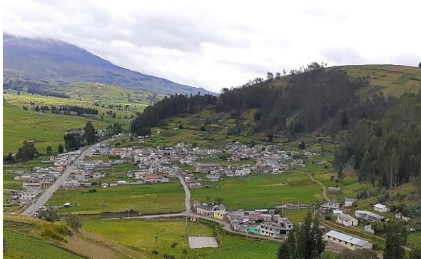
Fuente: Vista panorámica de la comunidad Santa Teresita de Guabug Tomada por: Evelyn Lema