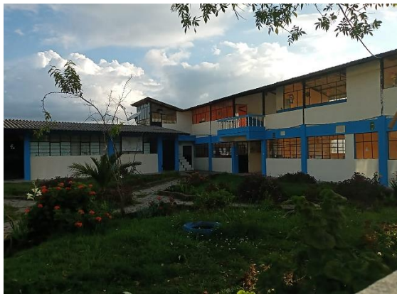
Fuente: Unidad Educativa Intercultural Bilingüe "Interandina" Tomada por: Evelyn Lema