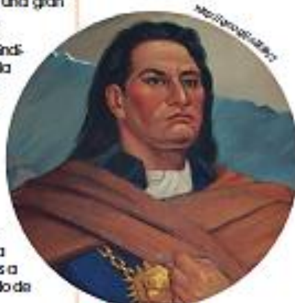
■ Túpac Amaru II

Para conocer el relato completo de la rebelión mira esta película siguiendo este enlace: https://goo.gl/CbfUD9