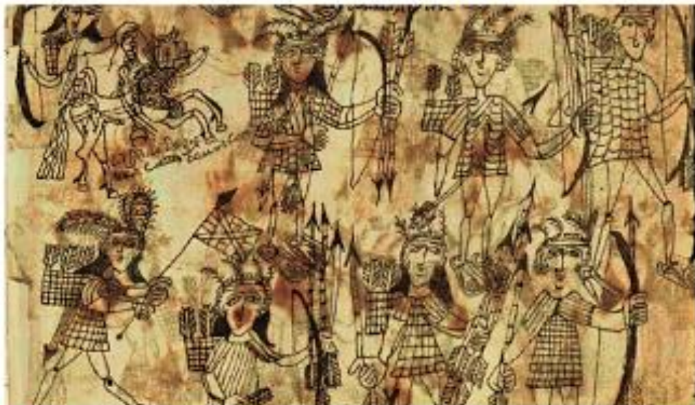
■ Indios otomíes conquistadores de la región del Bajío