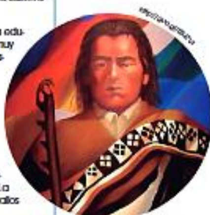
■ Túpac Katari

Para conocer más sobre Túpac Katari, mira el documental que sigue a este enlace: https://goo.gl/4QC9s